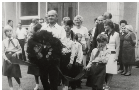
Skladanie vencov k Pomníku padlých