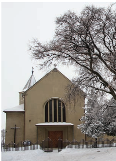
Farský kostol v zovretí zimy