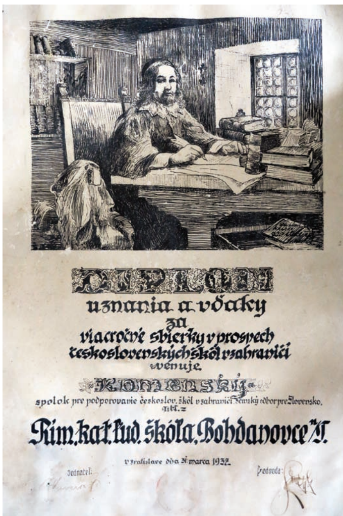
Diplom uznania Rímskokatolíckej ľudovej školy Bohdanovce 31. 3. 1937