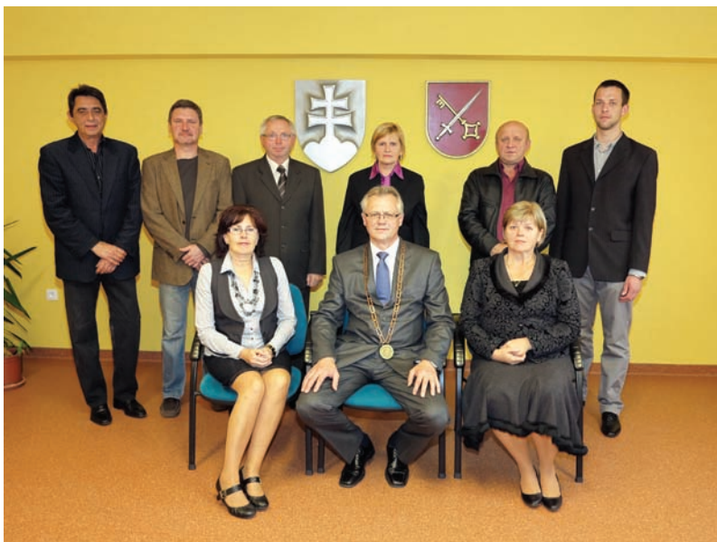
Poslanci obecného zastupiteľstva v novembri 2012