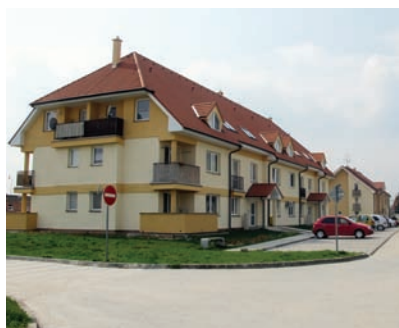
Obecné nájomné byty