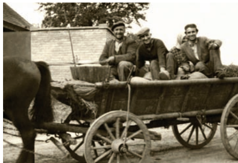
Obraz, ktorý už patrí minulosti.