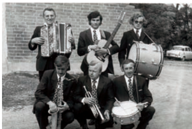
Hudobná skupina SYNKOPY