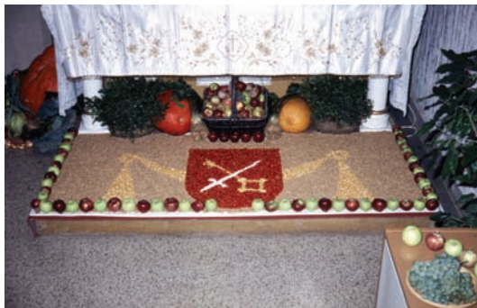
Vďakyzvanie za úrodu vo farskom kostole