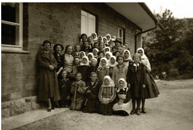
Skupinová fotografia z roku 1938