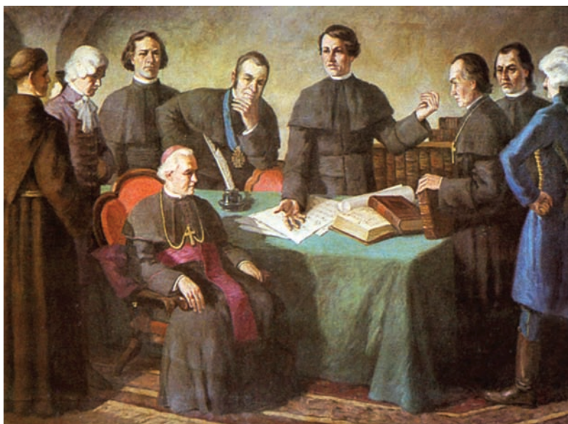
Zakladanie Slovenského učeného tovarišstva v roku 1792.