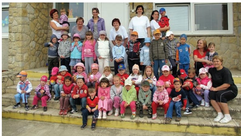
Deti materskej školy

mätnú medailu s evidenčným číslom 3132 za účasť v boji proti fašizmu a za oslobodenie vlasti.