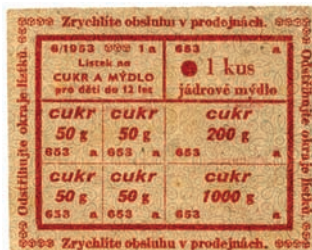
Dobový potravinový lístok