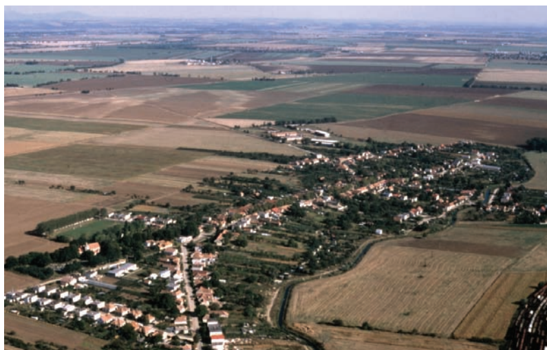
Letecký pohľad na obec