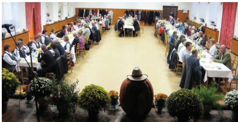
Posedenie s dôchodcami 2011