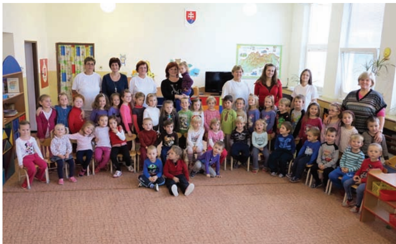
Deti materskej školy so svojimi učiteľkami v roku 2012