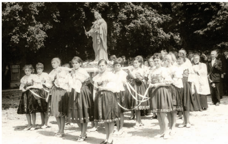
Nesenie sochy Panny Márie Pomocnice kresťanov 13. júla 1969