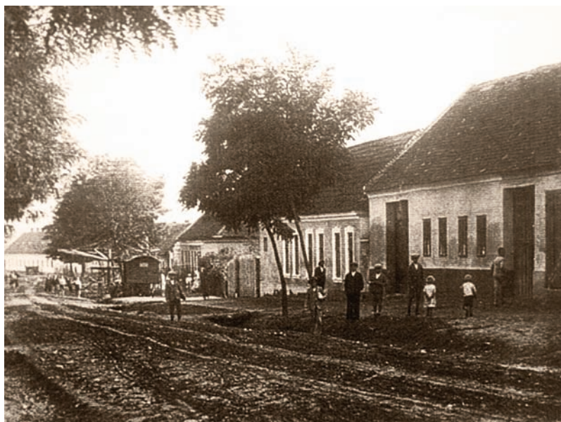
Hlavná ulica kedysi