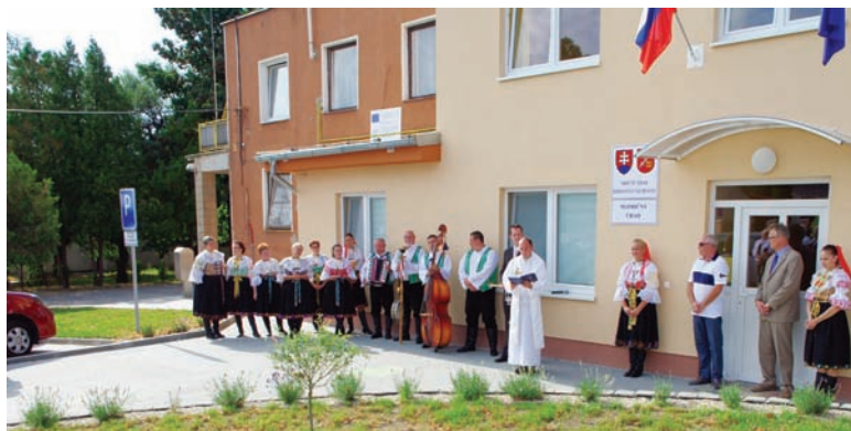
Otvorenie a posviacka prístavby kultúrneho domu

v lokalite Vršok II. Pre lokalitu Mladý potok od farského úradu po Krajčovičovu uličku. Spracovávali sa projekty pre inžinierske siete potrebné k zástavbe IBV.