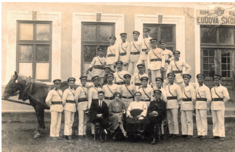
Zakladajúci členovia obecného hasičského zboru v r. 1924