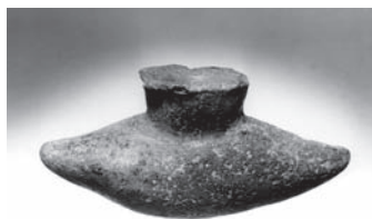
Kultová nádoba z doby bronzovej