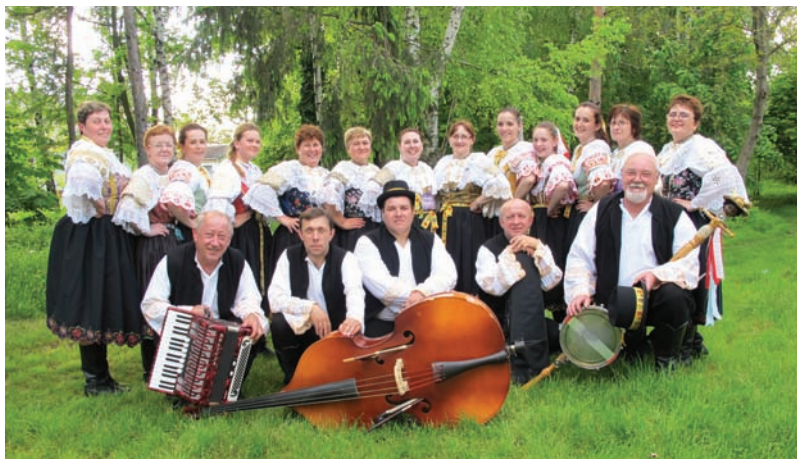
Folklorný súbor Žofia