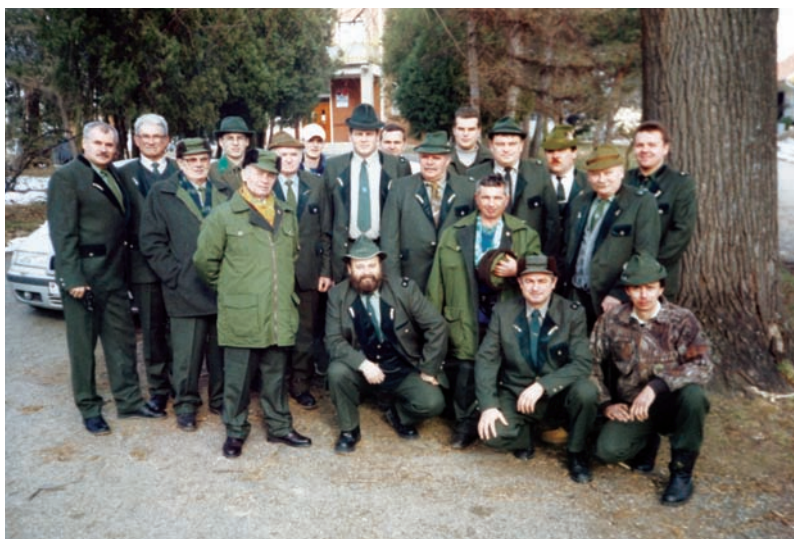
Členovia miestneho Poľovného združenia Jarabica