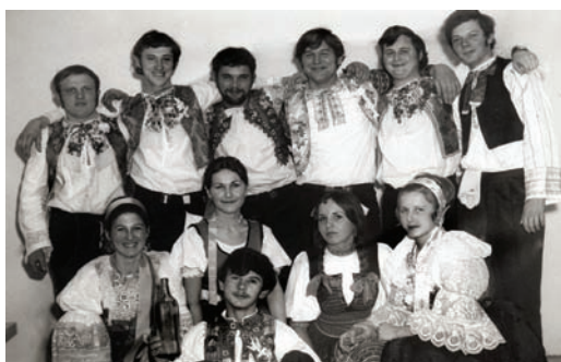
Podmanivosť nášho kroja