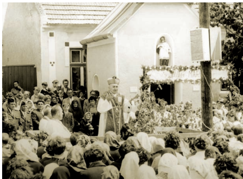
Posviacka kaplnky Panny Márie Pomocnice kresťanov 13. júla 1969