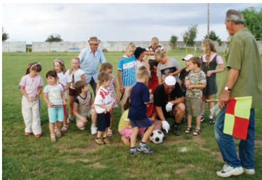
Hody (30. 6. 2008) Mladí športovci