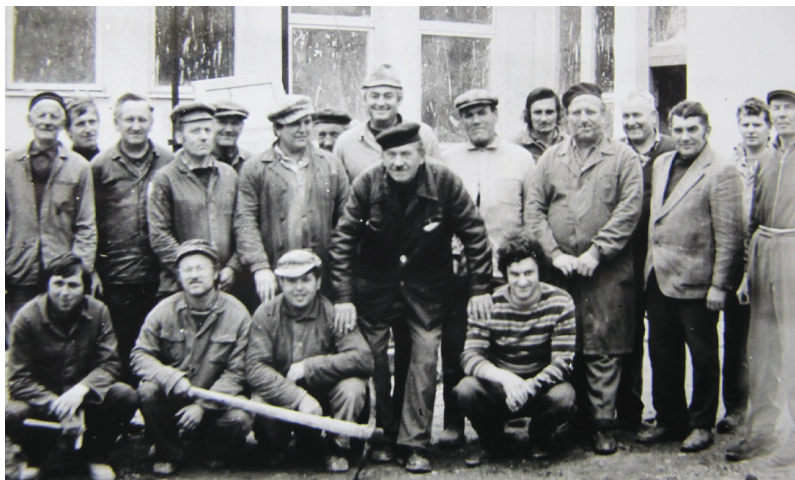
Výstavba materskej školy v roku 1980