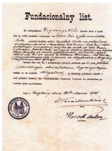
Fundacionálny list z roku 1905