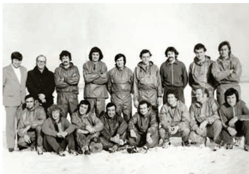
Miestni futbalisti na zimnom sústredení