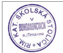
Pečiatka školskej stolice