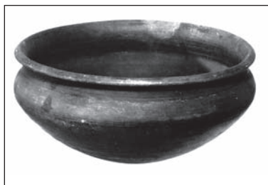
Laténska misa z Bohdanoviec