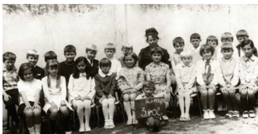
Na školskom dvore