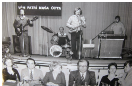
Posestie s dôchodcami v roku 1983