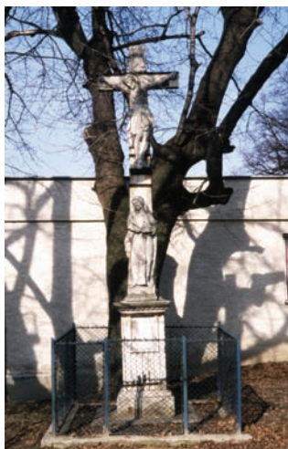
Križ z roku 1804