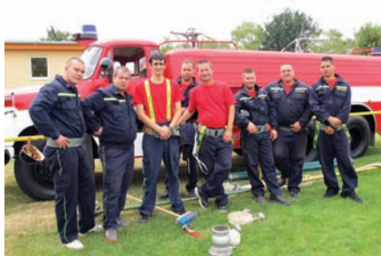
Súťaž požiarnikov na ihrisku