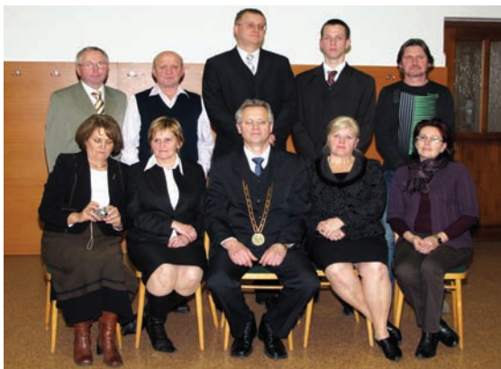
Novozvolení poslanci v roku 2010