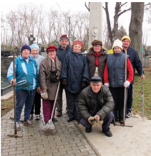
Brigáda na cintoríne

strana – 4, Paliho Kapurková, veselá politická strana – 4, Komunistickej strane Slovenska – 4, Únia – Strana pre Slovensko – 3, Združenie robotníkov Slovenska – 3, Strana rómskej koalície – SRK – 1 odovzdaný hlas, Strana maďarskej koalície – Magyar Koalíció Pártja a AZEN – Aliancia za Európu národov nezískali v Bohdanovciach ani jeden hlas.