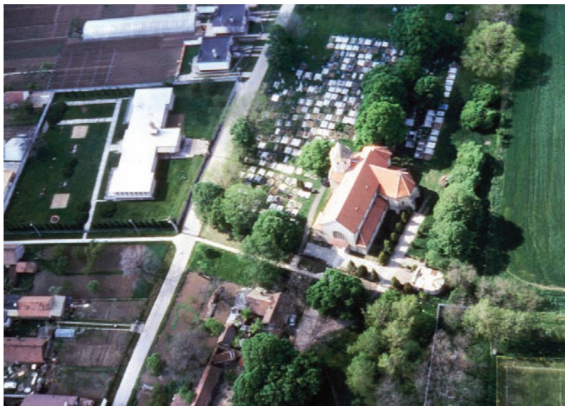
Farský kostol z vtáčej perspektívy

kánskeho štúdia vo vtedajšej Mariánskej provincii v Bratislave. V roku 1779 bol gvardiánom v Nitre. Nasledujúce tri roky žil v Trnave a ďalšie dva bol gvardiánom na Sv. Katarínke pri Naháči. Roky 1785 – 1793 strávil opäť v Trnave a tri posledné z nich vo funkcii gvardiána. Dňa 15. augusta 1794 ho zvolili za provinciála. Po uplynutí trieniumu sa vrátil do Trnavy a tam ho 8. septembra 1803 druhýkrát zvolili za provinciála. Po uplynutí trojročnej doby pôsobnosti odchádza na odpovädok do Trnavy, kde 18. marca 1816 zomrel.