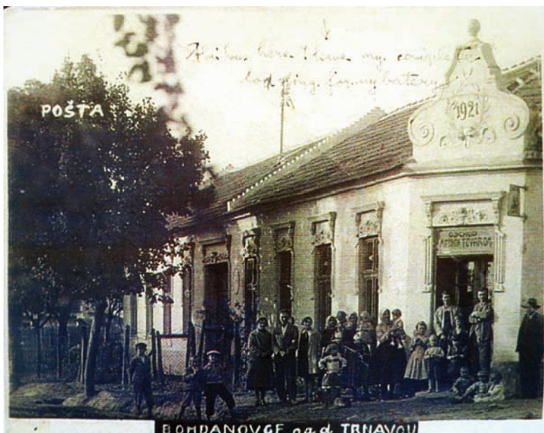
Budova pošty, dnes sídlo firmy ELVÝRO