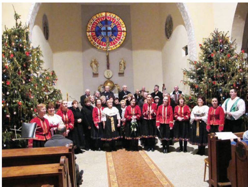
Vianočný koncert 2011