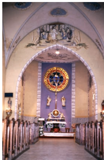
Interiér farského Kostola sv. Petra a Pavla v Bohdanovciach nad Trnavou