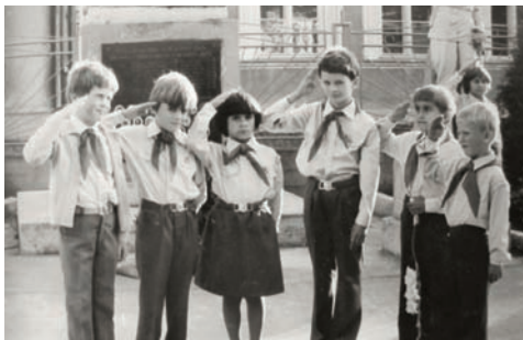
Skladanie pionierskeho slubu