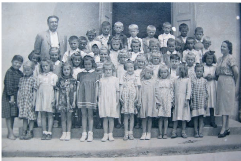
Žiaci so svojimi učiteľmi

skutočný stav 106 kusov. Plánované stavy sa dosiahli v chove ošípaných. Plánovaný stav bol 858 kusov, skutočný stav bol o 150 kusov vyšší. Plánovaný stav u prasníc bol taktiež dosiahnutý. Chovalo sa 2157 kusov hydiny, no plán určoval 3900 kusov. Krmovinná základňa bola nedostačujúca, a preto sa krmivo muselo nakupovať zo štátnych fondov.