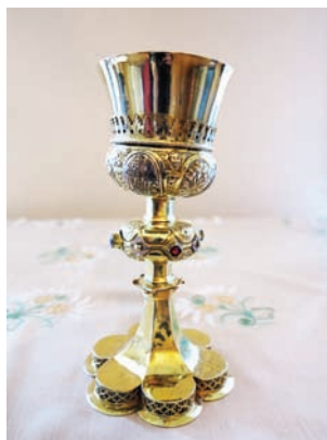
Kalich z roku 1601