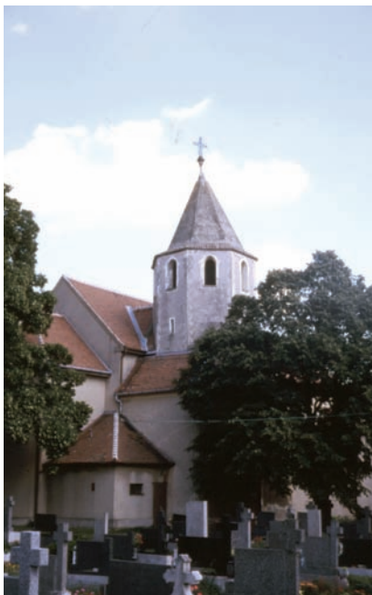
Farský Kostol sv. Petra a Pavla