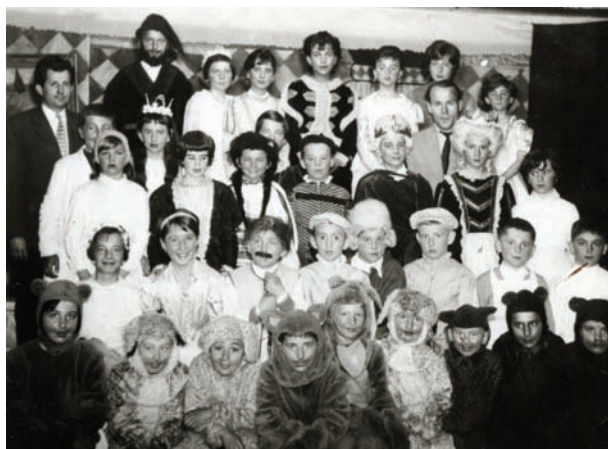
Divadelná hra Úbohý Anička z roku 1965