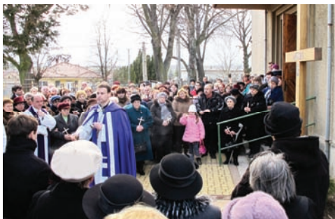
Sväté misie 2010