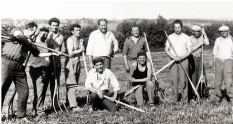
Polovníci pomáhajú miestnemu JRD.