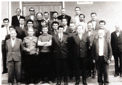
Poľovníci z Bohdanoviec a zo Šelpíc