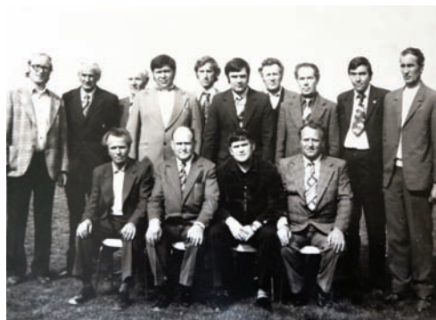
Futbalisti aj funkcionári