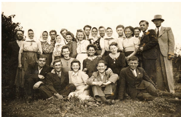
Divadelný súbor SLOVAN v roku 1941

(3. a 5 ročník) a chodilo tam 51 detí (19 chlapcov a 32 dievčat) a v tretej triede vyučoval ročníky 4., 6., 7. a 8. Viliam Šikula. Ten mal v triede 74 detí, z toho 20 chlapcov a 54 dievčat. Školu teda navštevovalo 182 žiakov. Viliam Šikula dlho triednym nebol, lebo 6. septembra 1942 odišiel pôsobiť na Ministerstvo hospodárstva do