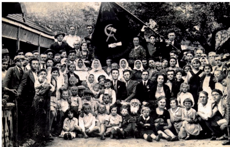
Odhalenie červenej zástavy v Bohdanovciach 29. 4. 1934