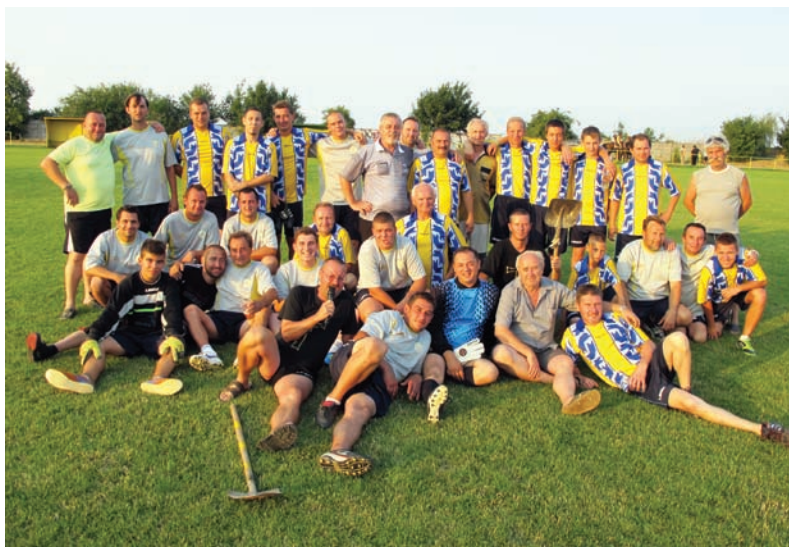
Hodový zápas Petrovci a Pavlovci 2012