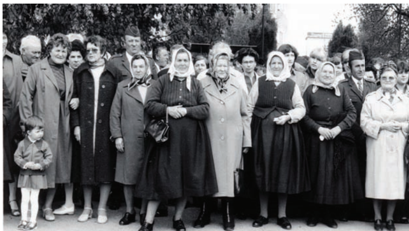
50. výročie odhalenia červenej zástavy v roku 1984