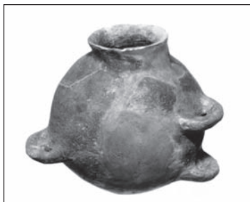
Nádoba baňatá – neolit lokalita Bohdanovce