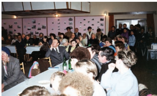
Oslavy ku 660. výročiu od prvej zachovanej písomnej zmienky o obci.