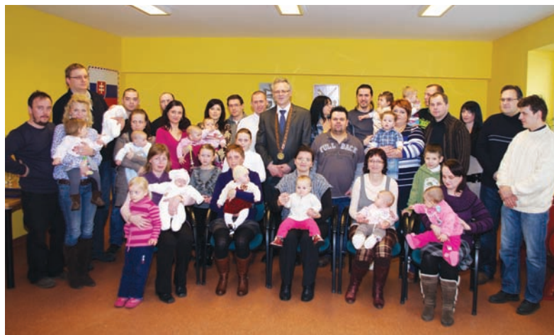
Utváranie detí do života v roku 2012