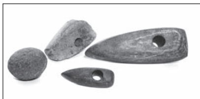
Súbor kamenných artefaktov z neolitu lokality Bohdanovce

hladených a následne vŕtaných kamenných nástrojov. Ako materiál sa používali predovšetkým amfibolitické bridlice. 2 Menej viditeľné torzá z tejto doby nachádzame v lokalite Babin-dol 3 , kde dnešný nevyrazný prameň bol v minulosti pomerne výdatným tokom a spĺňal základnú podmienku existencie roľníckej civilizácie, ktorou