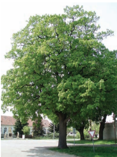
Jedna z 220-ročných líp lemujúcich cestu ku kostolu