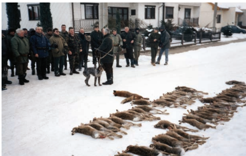
Poľovníci so svojimi úlovkami v roku 2001