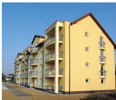
Bytová výstavba s 22 bytmi C.O.G.E.R.S.

poplatok 200Sk za dieťa na mesiac sa stav znížil o 4 deti. Školský rok sa skončil 30. júna 1995 a do prvého ročníka ZŠ odišlo 6 chlapcov a jedno dievča.