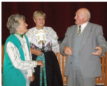
Naši jubilanti (22. 10. 2006)