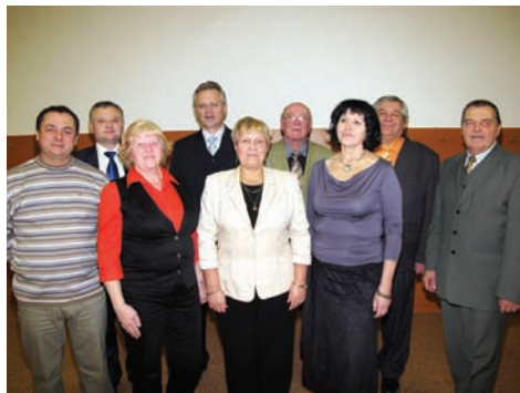
Poslanci vo volebnom období 2006 – 2010