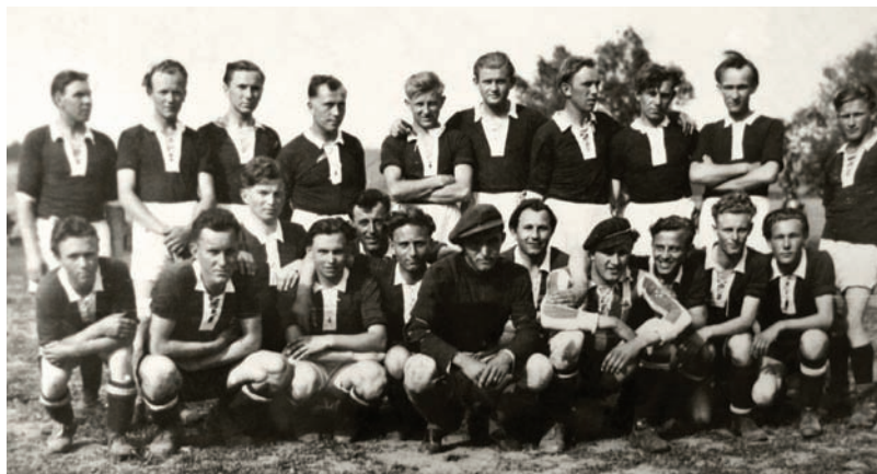
Futbalisti z roku 1949