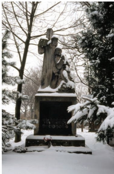
Pomník padlých v I. svetovej vojne