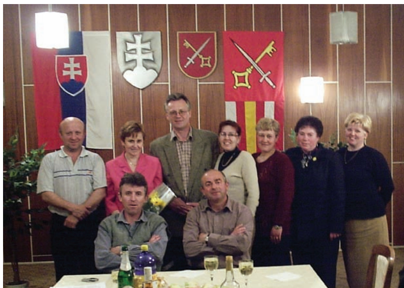
Poslanci vo volebnom období 2002 – 2006