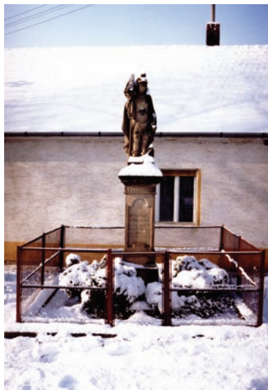
Socha sv. Filoména z roku 1907