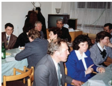
Z osláv 200. výročia Slovenského učeného tovaríštvá