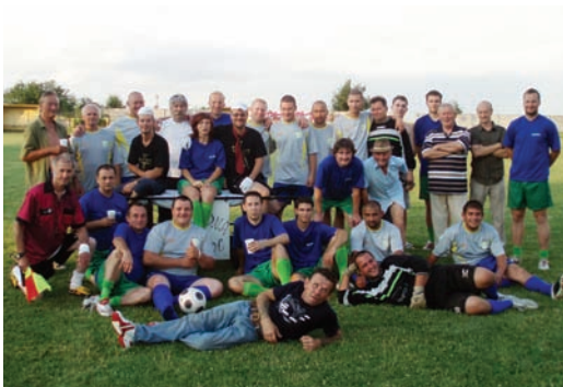
Hody (30. 6. 2008) Futbalový zápas Petrov a Pavlov