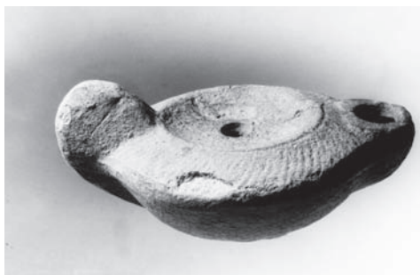
Kahanec z doby rímskej

ktorý úzko spolupracuje s príslušnými archeologickými inštitúciami. Jeho zásluhou sa tam z Dolného poľa dostal súbor rímskych spôn, medzi nimi aj deriváty spôn s podviazanou nôžkou. Pomerne početne sú zastúpené rímske mince, ktoré vyplňujú časový úsek od konca 2. stor. (Ju-