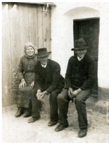
Atmosféra starých čias