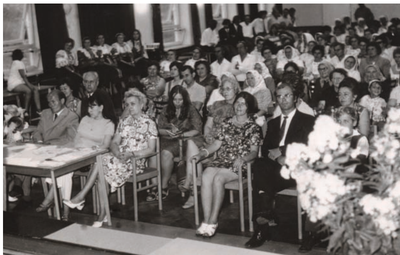
Sála kultúrneho domu osemdesiate roky