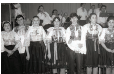
Folklorne pásmo „Svadba“ 24. 2. 1973