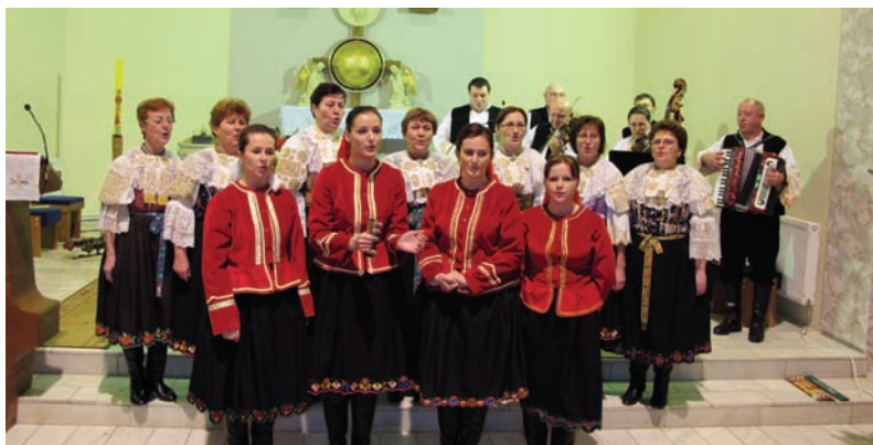
Vianočný koncert 2009 – folklórny súbor Žofia