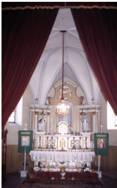
Pôvodné gotické sanktuárium