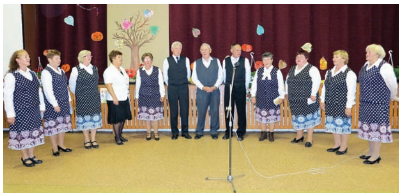
Spievácky súbor Bohdanovčan