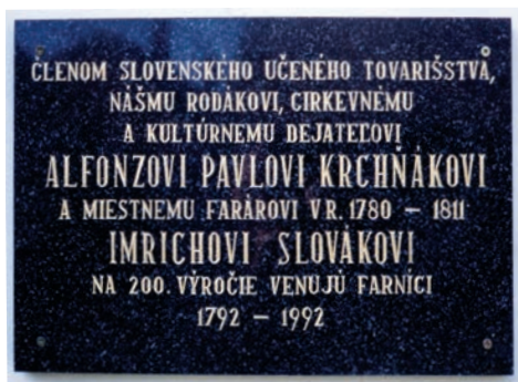
Pamätná tabuľa na budove fary