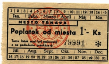
Poplatky za trhovú miesto