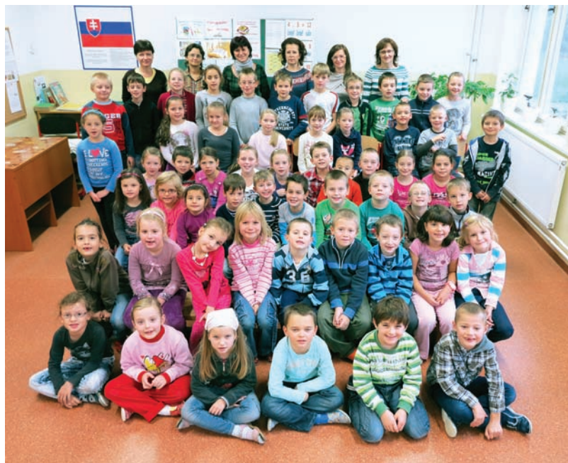
Žiaci so svojimi učiteľkami v roku 2012