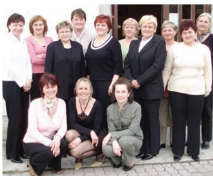
Deň učiteľov v roku 2006