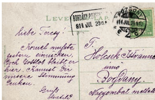
Pozdrav z roku 1914 adresovaný do Bohdanoviec

doplnáňy z trenčianskej, liptovskej a oravskej župy. Límcová identifikačná farba bola račia červená (krebrot). V čase vypuknutia prvej svetovej vojny malo Rakúsko-Uhorsko 102 peších plukov. 123