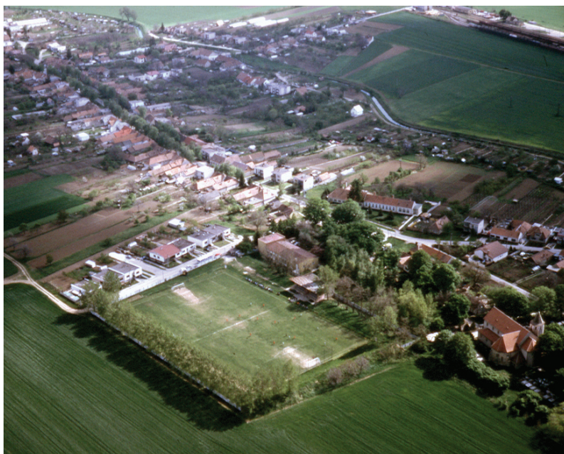
Pohľad na centrum obce