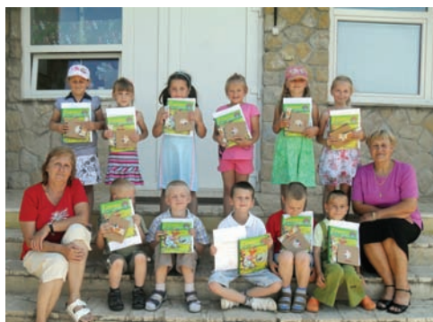
Predškoláci v roku 2010